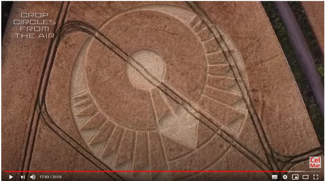
CROP CIRCLES 2020 : L'Amour est la Clé (Lulumineuse, Olivier S., Umberto Molinaro, Philippe Mariaud)

Dans cette vidéo publiée sur la chaîne Youtube de Rémy Celmar , ce dernier compile des messages synthétiques à propos de ce crop circle apparu dans un champ il y a quelques mois... Inutile de décortiquer les symboles de ce crop pendant des heures, inutile de prétendre connaître tous les messages qu'il souhaite sans doute transmettre : la compréhension a d'abord lieu dans l'inconscient ! Ce coeur ailé est comme une clé dont le coeur, le centre, est justement un... coeur. (PS : il faut cliquer sur l'image pour accéder à la vidéo)